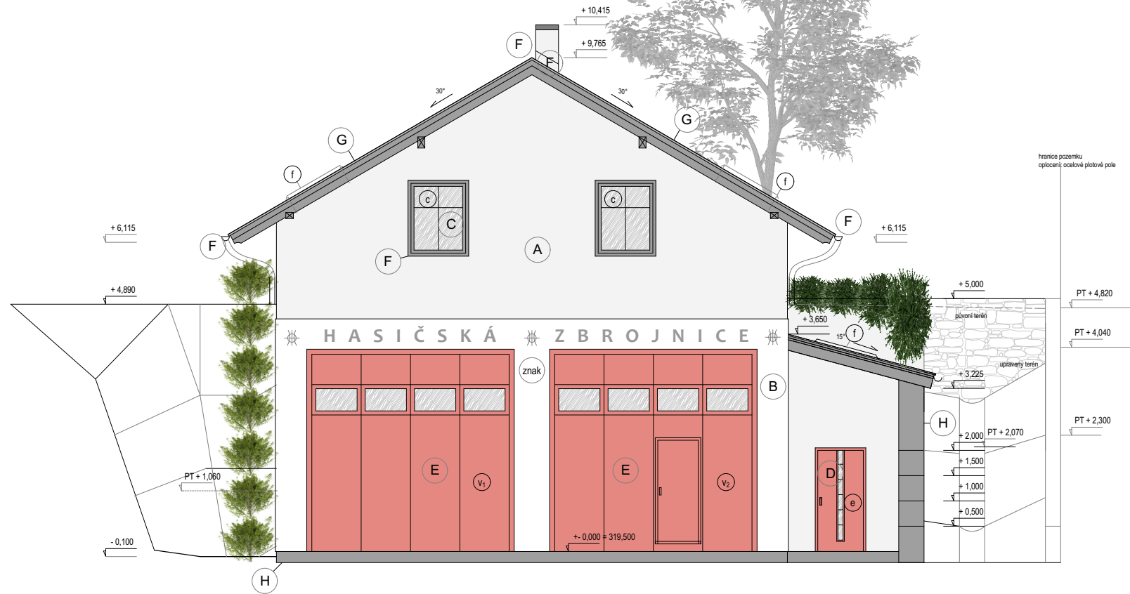
POHLED SEVERNÍ sklon střechy 30

±0,000 = 319,500 m.n.m BPV, POLOHOPIS - MÍSTNÍ SYSTÉM